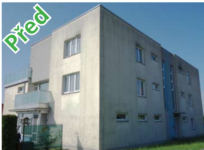
Bytový dům Hojerova 1316/13, Plzeň, realizace 2019