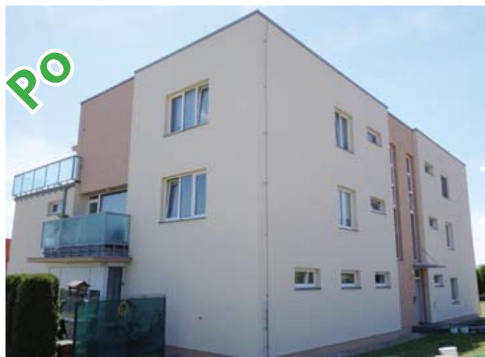
sanační systém Mistral s nátěrem silikonovou fasádní barvou Mistral Silikon