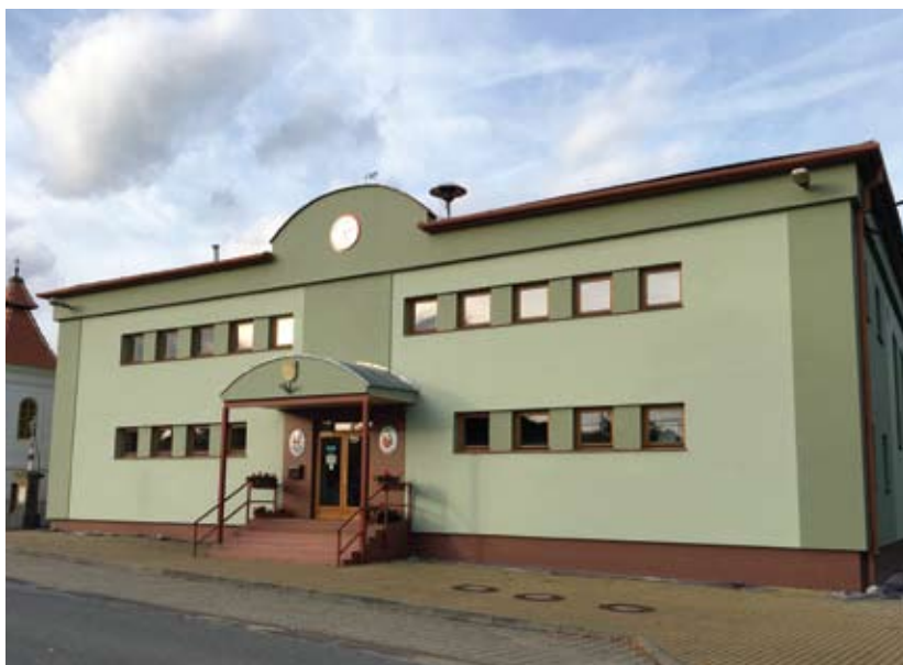
OU Mohelno, realizace 2017, nátěr silikonovou fasádní barvou Mistral Silikon