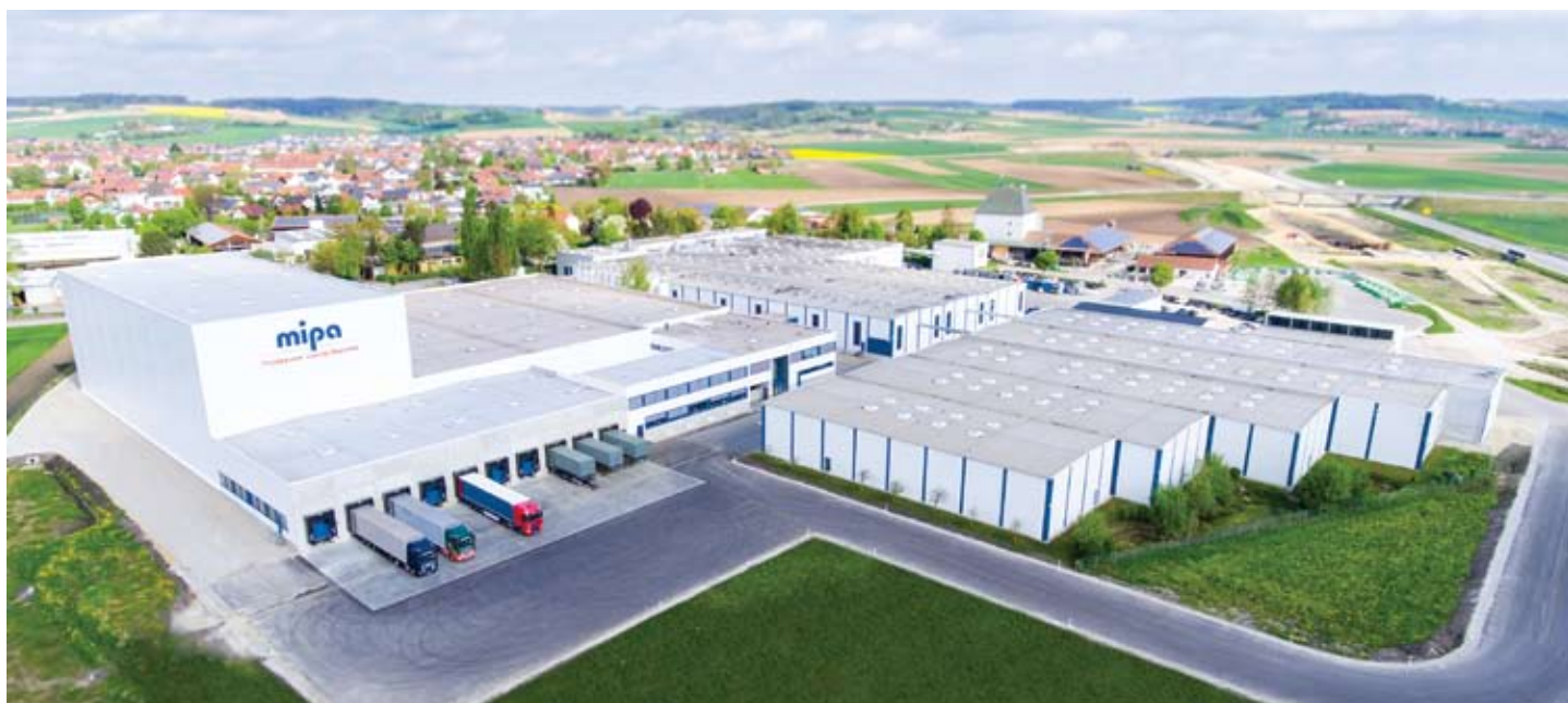
Mipa SE Německo, Essenbach