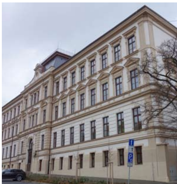
Gymnázium J. A. Komenského Uherský Brod, realizace 2015, nátěr silikátovou fasádní barvou Mípa Fassaden Silikatfarbe